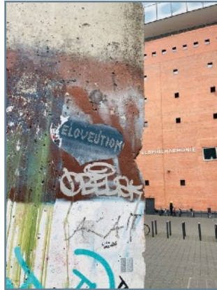
Foto des Mauerstücks am Platz der Deutschen Einheit vor der Elbphilharmonie